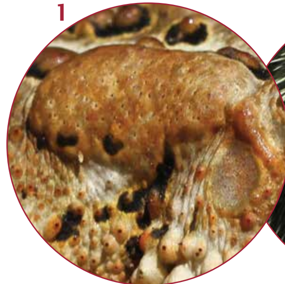
glándula del veneno