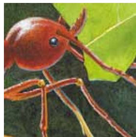
F. las hormigas podadoras