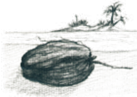
B. Un coco en el mar