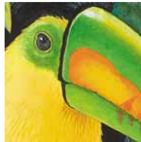
C. los tucanes