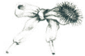
E. Un cardo en una agujeta