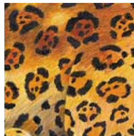
G. los jaguares