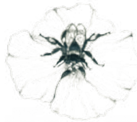
A. Un abejorro en una flor