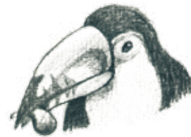
D. Un tucán comiendo un higo