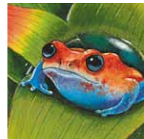
H. las ranas venenosas