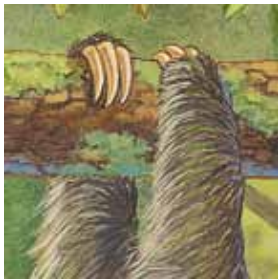
A. los perezosos