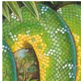
B. las boas esmeraldas