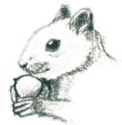
F. Una ardilla con una bellota