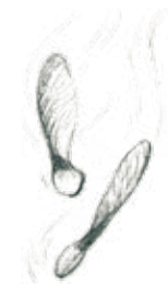
G. Semillas "Whirlybirds" del Arce