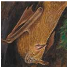
E. los murciélagos