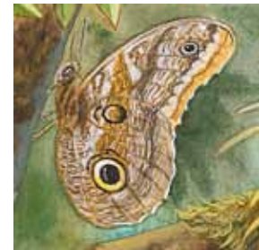
D. las mariposas búho