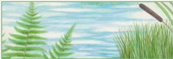
estanques, pantanos, y ríos lentos