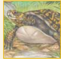
tortuga de caja